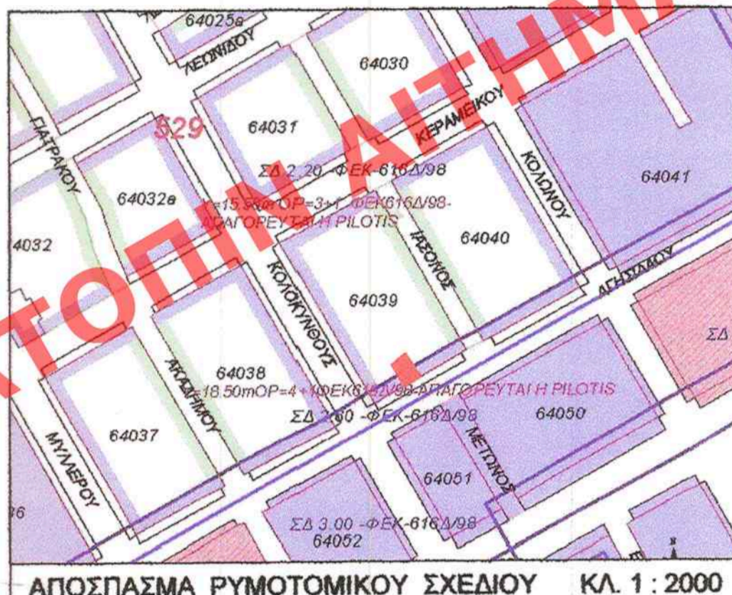
ΑΠΟΣΠΑΣΜΑ ΡΥΜΟΤΟΜΙΚΟΥ ΣΧΕΔΙΟΥ ΚΛ. 1 : 2000